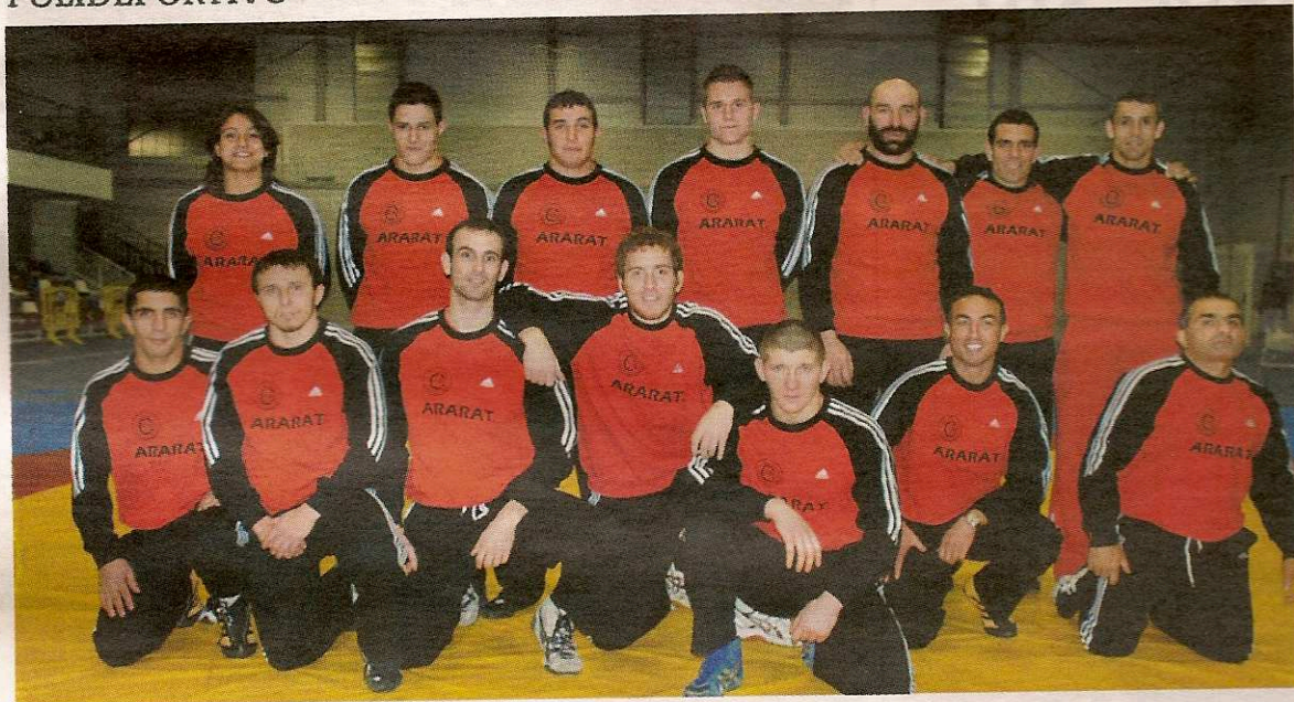
Los integrantes del Club de Lucha Ararat Rivas se darán a conocer el próximo sábado 1 de diciembre a los aficionados ripenses en el Parque del Sureste.